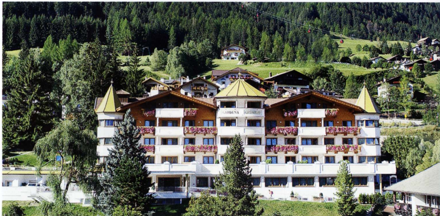
Das feine Urlaubsdomizil liegt im Bergdorf St. Ulrich im Herzen des Grödnertals.